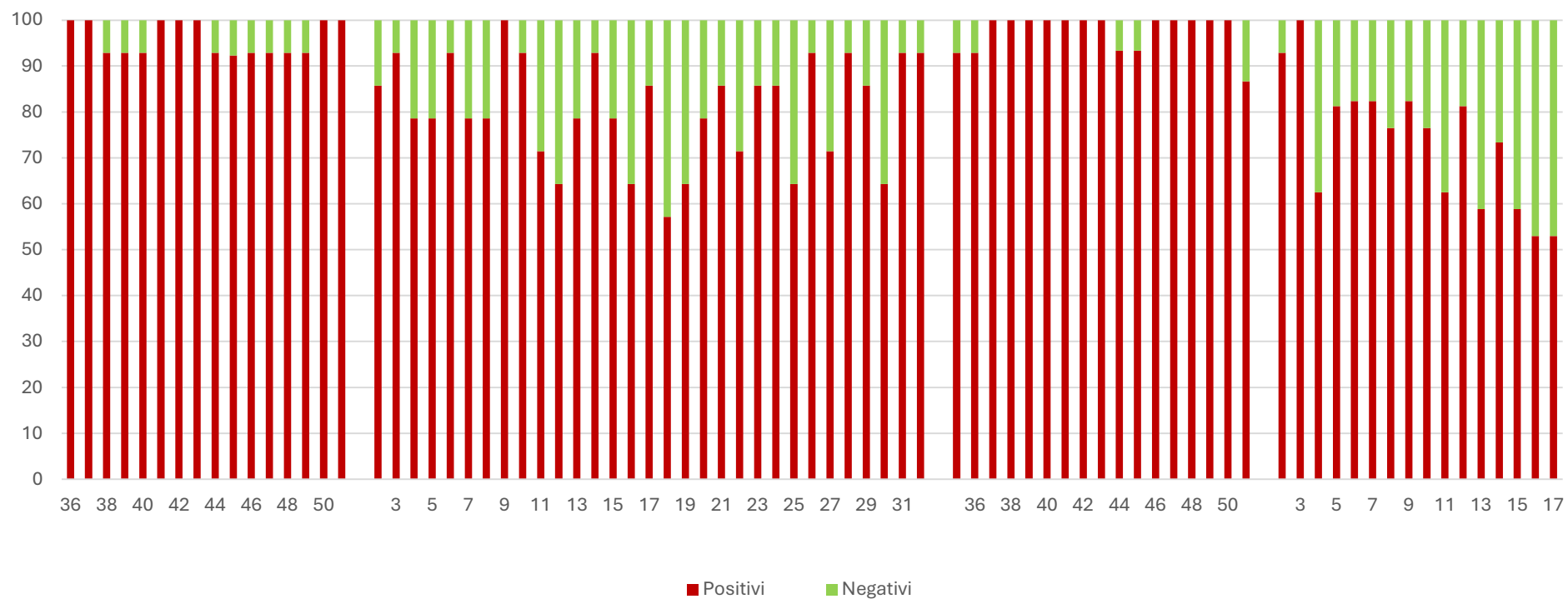
SARS-CoV2 (N1) %

I grafici seguenti mostrano i dati settimanali riportati in tabella 1 e in tabella 2, è presente un grafico per ogni virus monitorato: