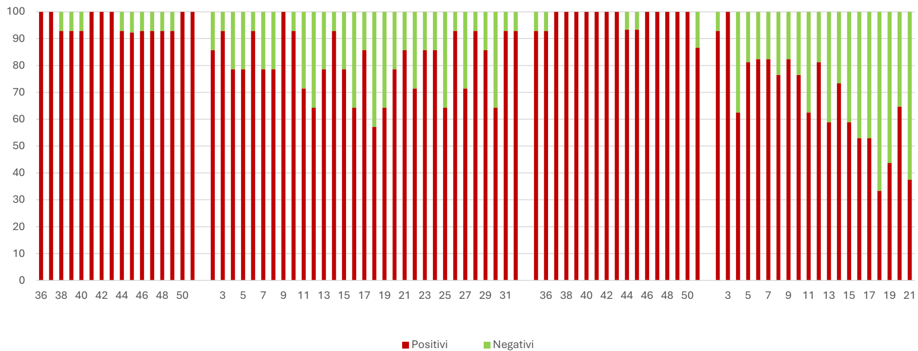
SARS-CoV2 (N1) %

I grafici seguenti mostrano i dati settimanali riportati in tabella 1 e in tabella 2, è presente un grafico per ogni virus monitorato: