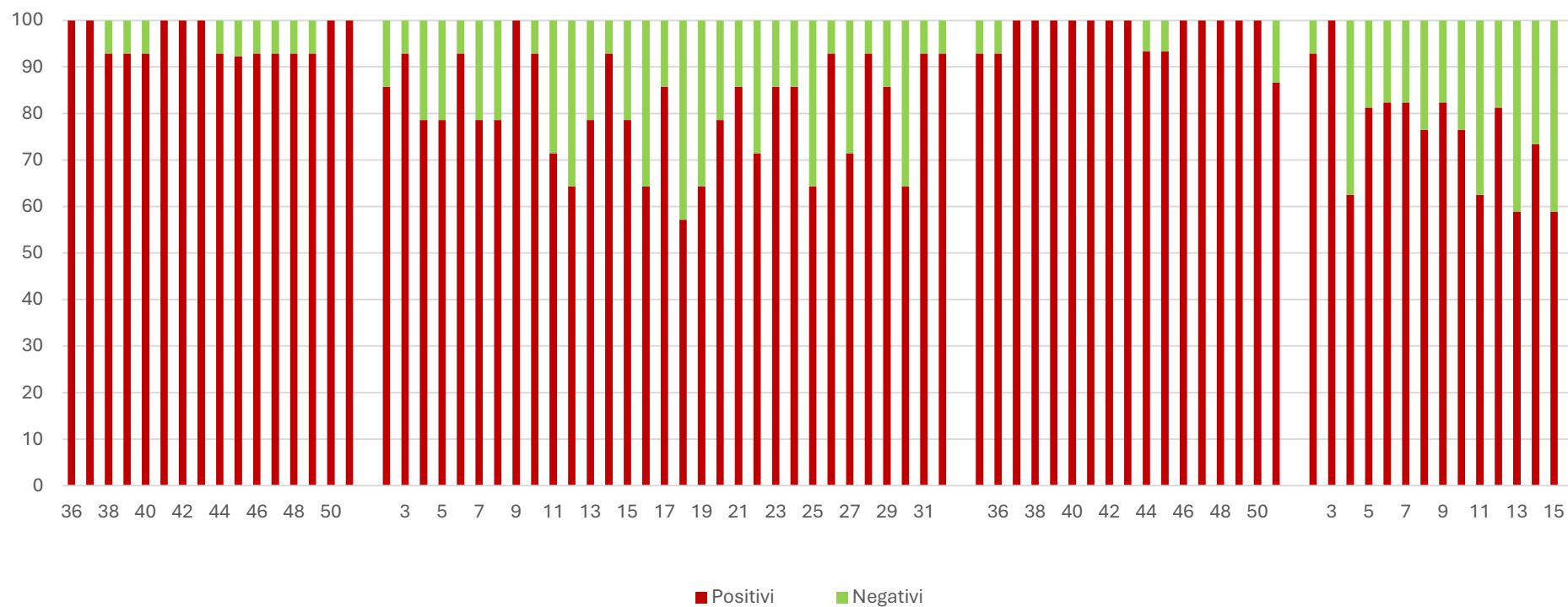
SARS-CoV2 (N1) %

I grafici seguenti mostrano i dati settimanali riportati in tabella 1 e in tabella 2, è presente un grafico per ogni virus monitorato: