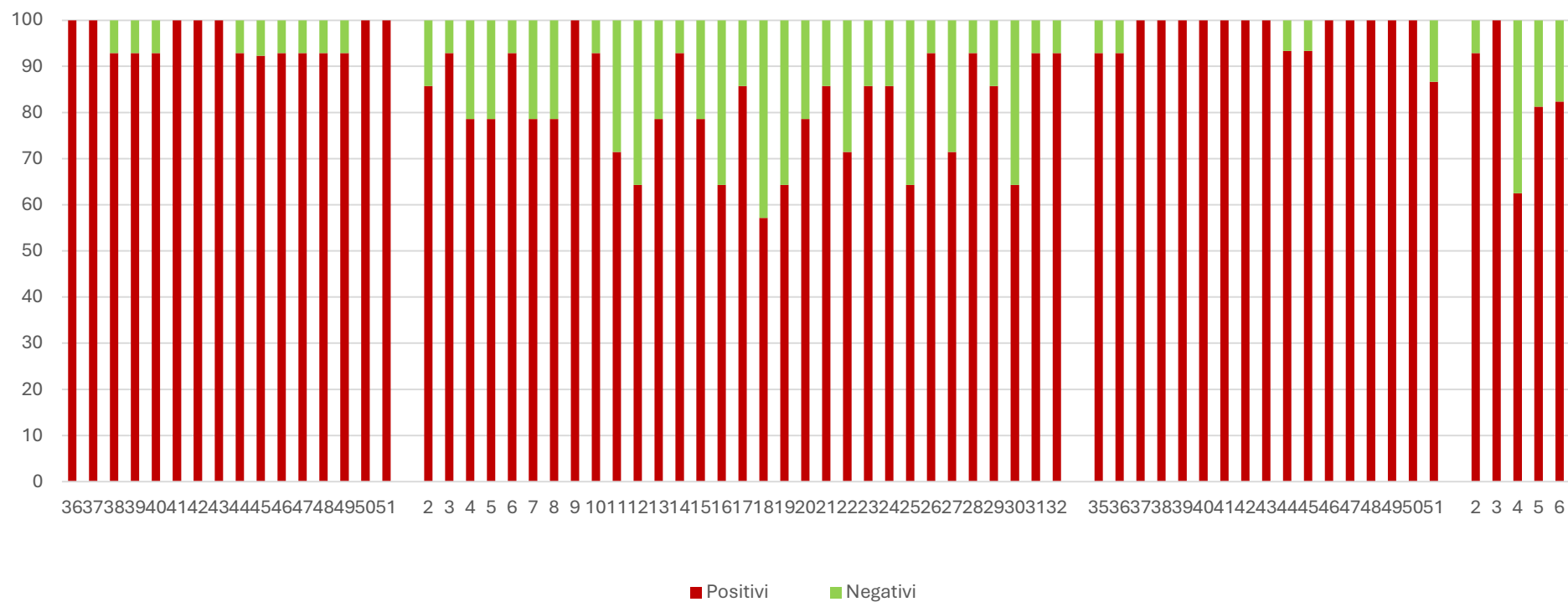
SARS-CoV2 (N1) %

I grafici seguenti mostrano i dati settimanali riportati in tabella 1 e in tabella 2, è presente un grafico per ogni virus monitorato: