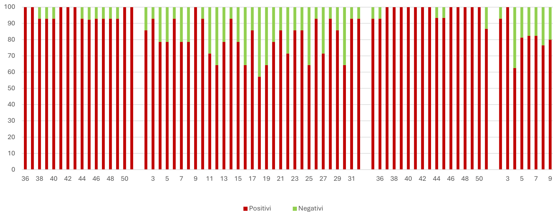
SARS-CoV2 (N1) %

I grafici seguenti mostrano i dati settimanali riportati in tabella 1 e in tabella 2, è presente un grafico per ogni virus monitorato: