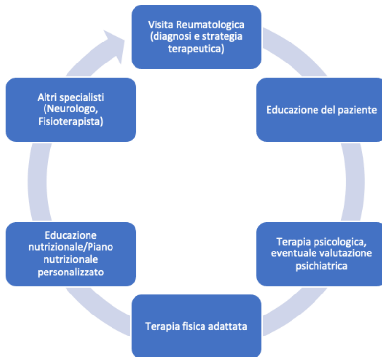
Figura 3: Percorso presso i Centri Multidisciplinari per la Fibromialgia