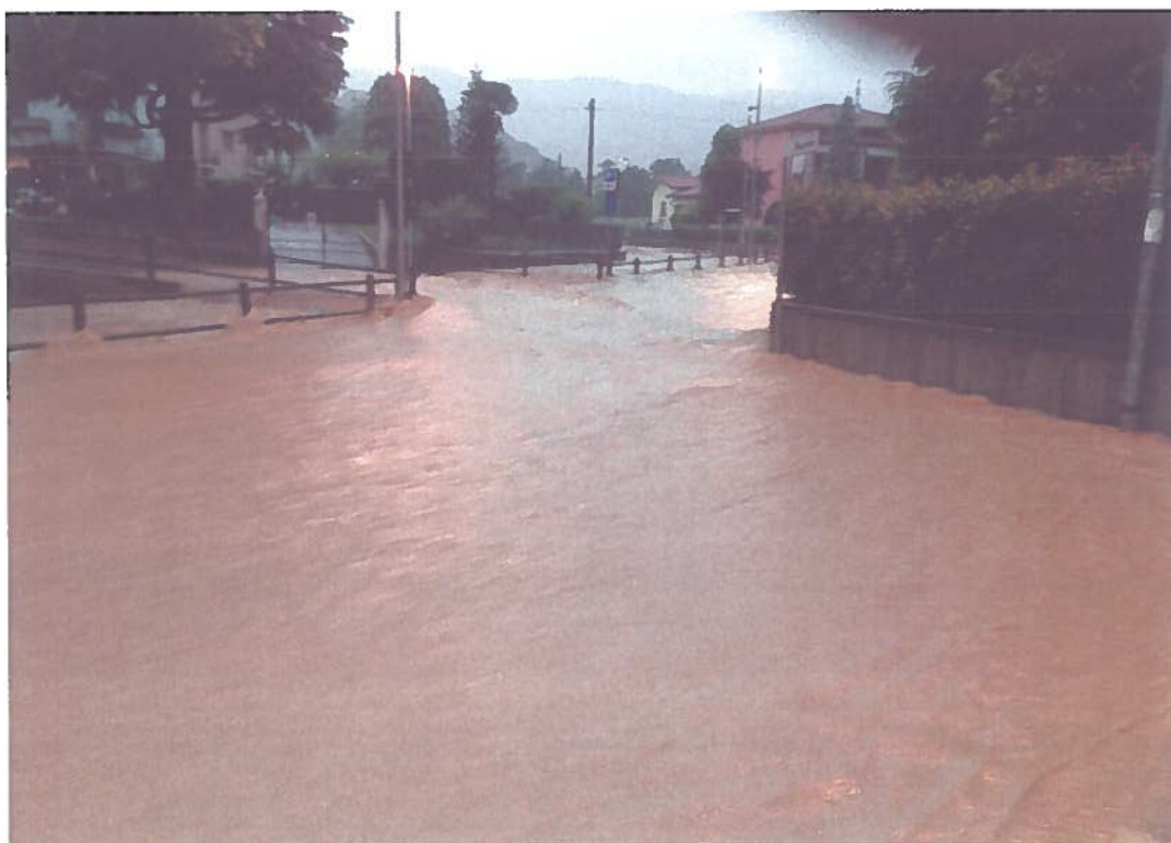
Comune di San Paolo d'Argon (BG)