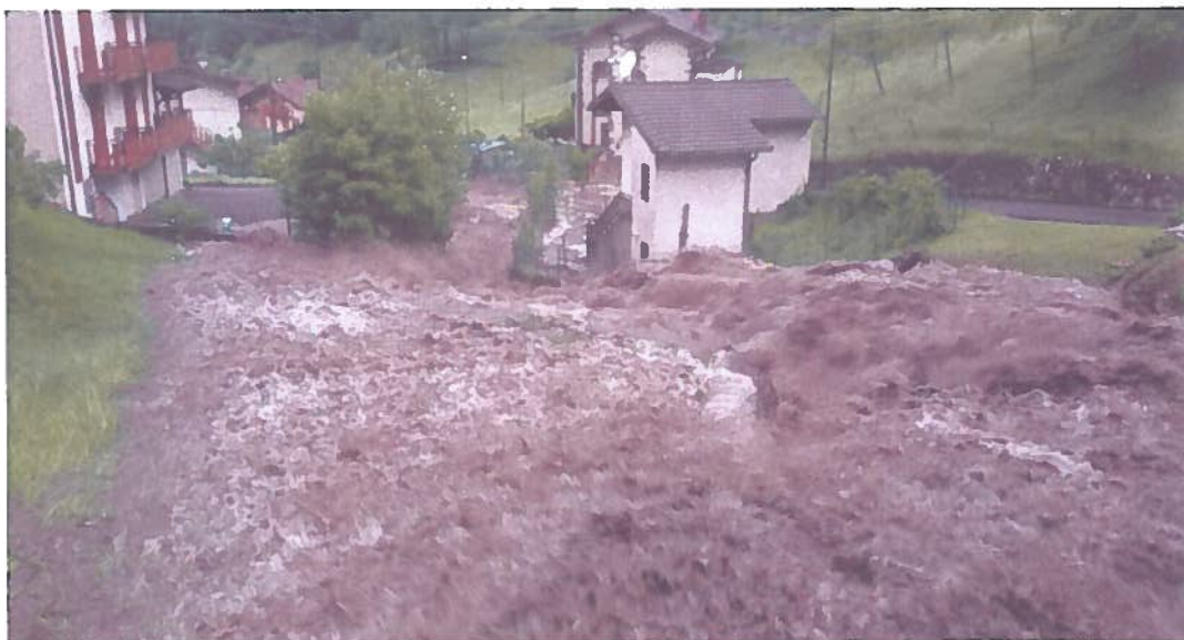
Comune di Cornalba (BG)

Ordinanza del Capo del Dipartimento di Protezione Civile n. 461 del 23.06.2017