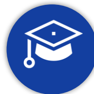
Piano Scuola Connessa