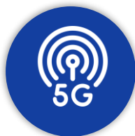
Piano Italia 5G