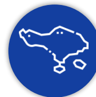
Piano Isole Minori