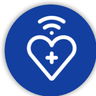
Piano Sanità Connessa

Circa 1.300 aree da coprire - densificazione