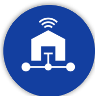
Piano Italia a 1 Giga

Nello specifico, attraverso la Divisione Italia Domani PNRR , Infratel Italia assegna le risorse pubbliche tramite procedure di gara, assicura il pronto avvio delle misure, coordina e verifica l'esecuzione delle attività affidate agli aggiudicatari per i seguenti Piani: