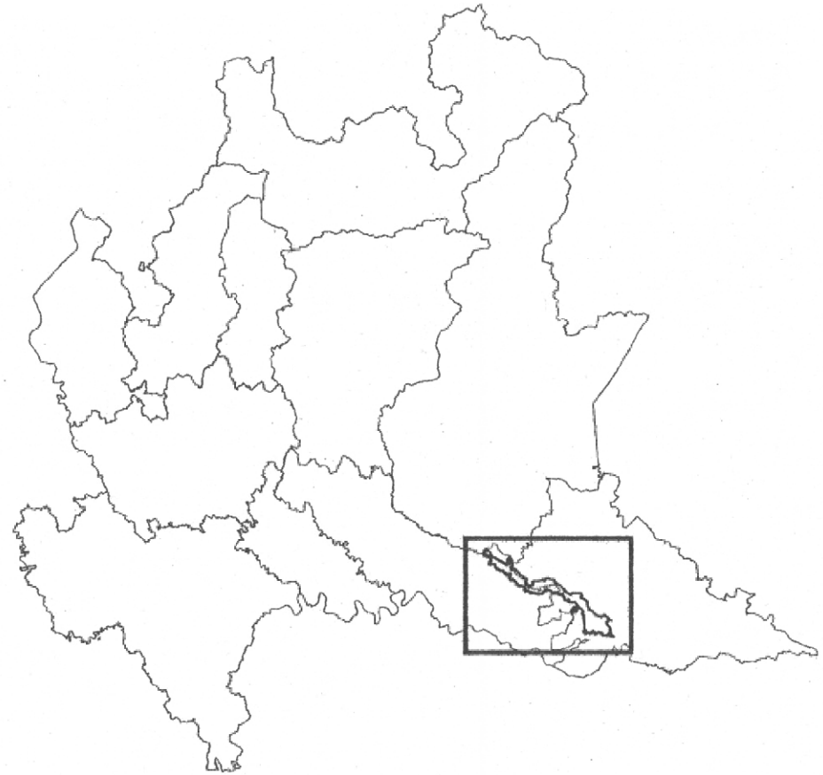
Individuazione del Parco Oglio Sud nel contesto geografico della Regione Lombardia

Periodo ripresa: Aprile 2003