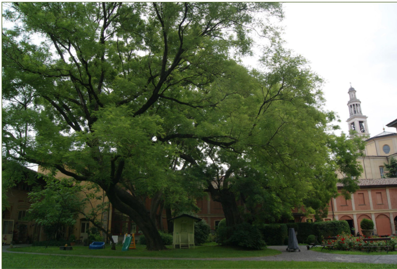
Sophora japonica – Seriate (BG)