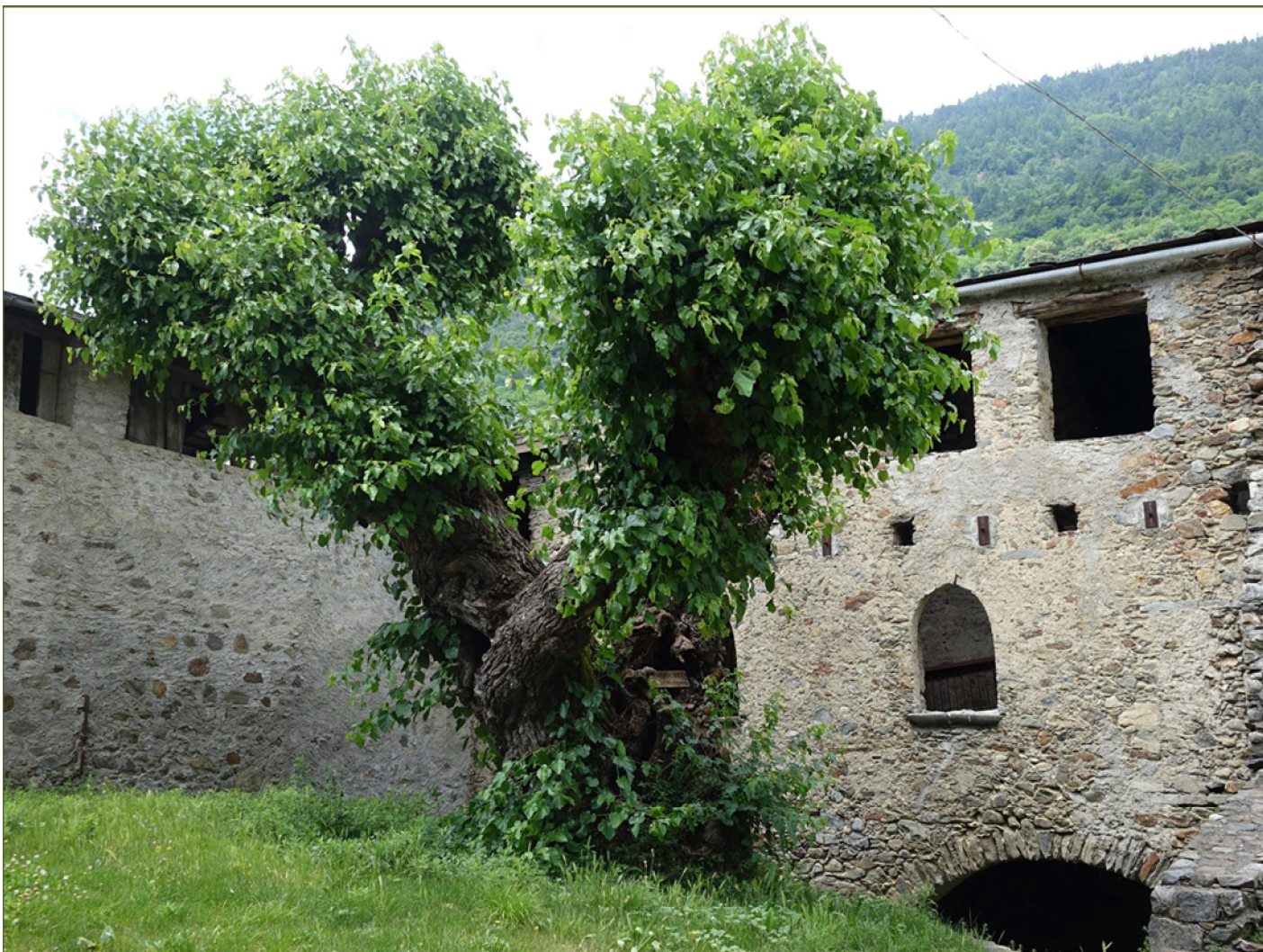
Morus alba – Ponte in Valtellina (SO)