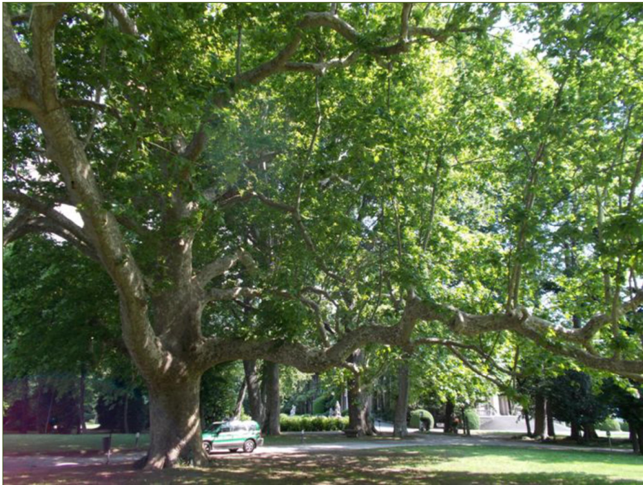
Platanus acerifolia – Cernobbio (CO)