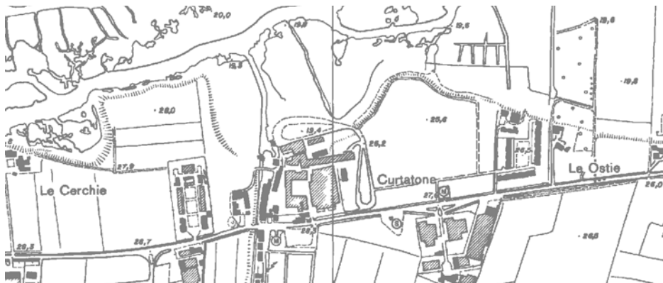
Estratto Carta Tecnica Regionale

L'ambito Marconi, in rapporto alla presenza del fiume Mincio (Lago Superiore), è interessato dalla presenza del limite di terrazzo fluviale che definisce principalmente due quote del terreno: una parte "alta" in attestazione alla viabilità ex statale esistente e una parte "bassa" verso il lago. L'ambito è costituito da immobili edificati e non edificati distribuiti alle diverse quote del terreno.