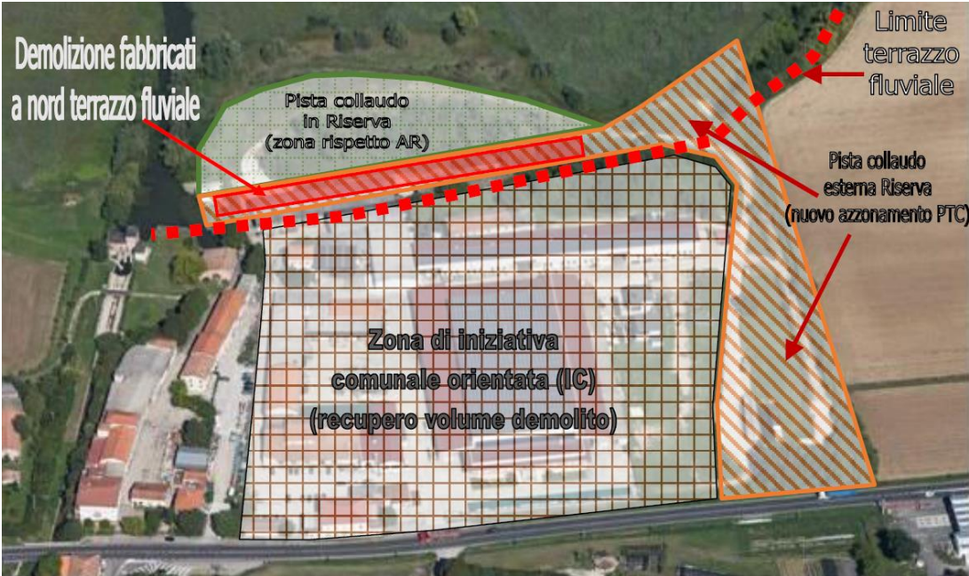
Vista aerea con individuazione delle aree di intervento

Aree ad uso produttivo, interessate da pista di collaudo dei mezzi, avente sedime in terra battuta, attività ritenuta incompatibile con le finalità della zona in cui insistono. L'area ricade, inoltre nella ZSC "Ansa e Valli del Mincio" e nella ZPS "Valli del Mincio". Per il tipo di attività svolta, occorre indagare i livelli di inquinamento del suolo, del sottosuolo, delle acque superficiali e sotterranee, atmosferico ed acustico.