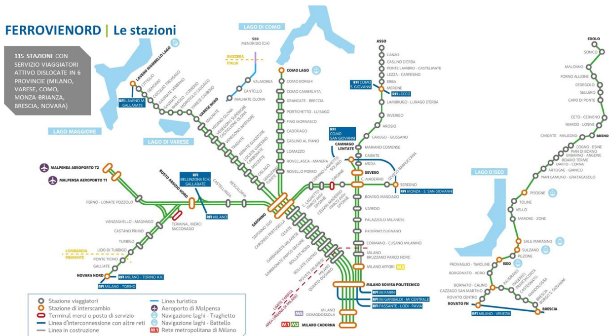
Figura 1 - I rami della rete infrastrutturale di FERROVIENORD S.p.A.