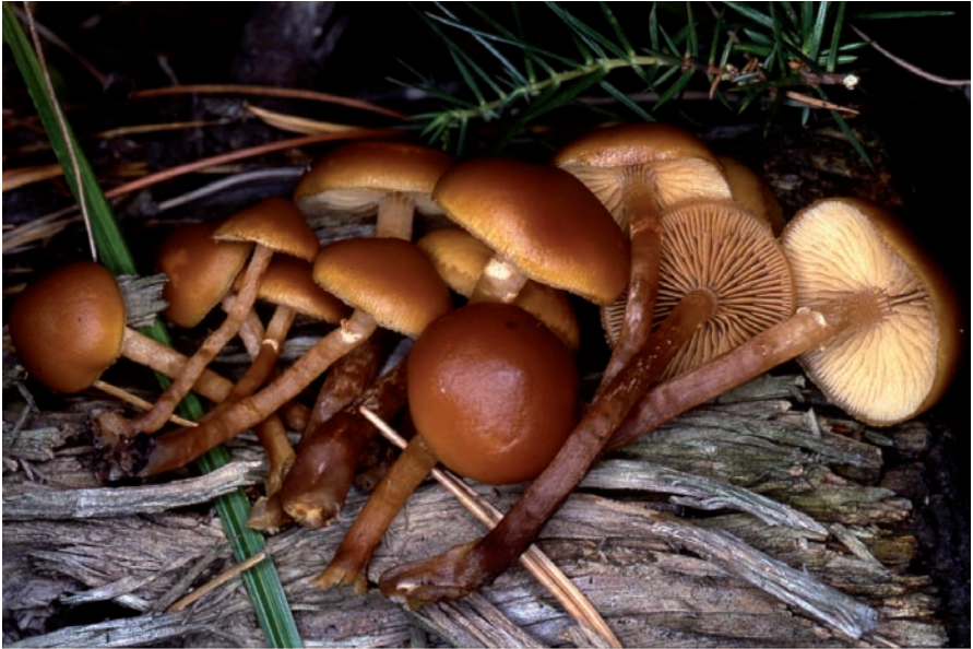
Galerina marginata : cresce a gruppi di numerosi individui, su ceppaie marcescenti di conifere, dall'estate all'autunno. È un fungo potenzialmente mortale dotato delle stesse tossine dell' Amanita phalloides .