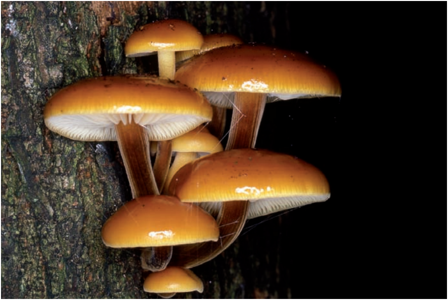
Flammulina velutipes : fungo tipicamente invernale, con periodo di fruttificazione da novembre a febbraio. Cresce cespitoso anche in densi gruppi, principalmente sui tronchi degli olmi. In cucina si presta bene, specialmente per gli intingoli.