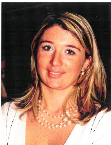
Viviana Beccalossi Vice Presidente e Assessore all'Agricoltura della Regione Lombardia

Con la certezza che questo documento sarà di indubbia utilità agli operatori di settore che vorranno farne buon uso, auspico che, come sempre, il tutto avvenga nel più rigoroso rispetto del patrimonio tartufigeno naturale presente sul territorio della "nostra" Regione.