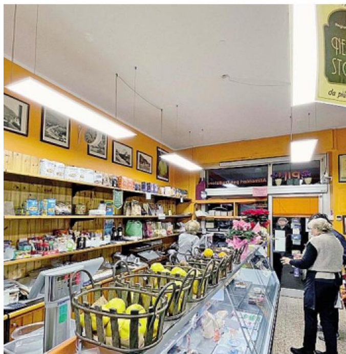
Bando regionale per aiutare i negozi alimentari nei piccoli Comuni