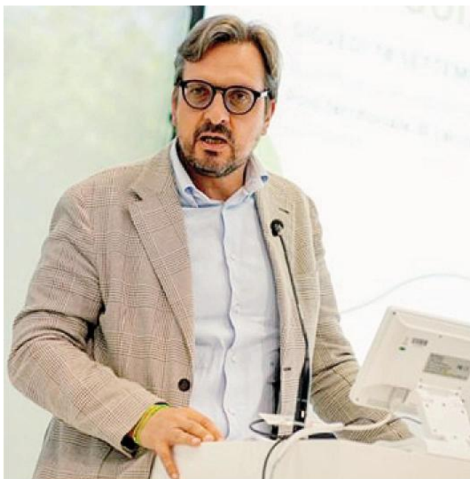
Guido Guidesi ARCHIVIO