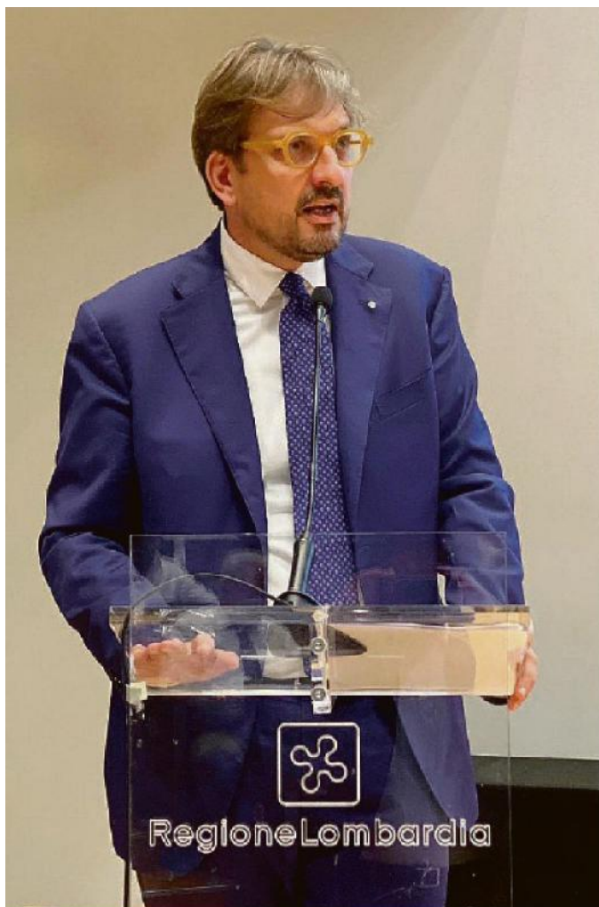
COMPETENTE Guido Guidesi , Sviluppo economico in Lombardia