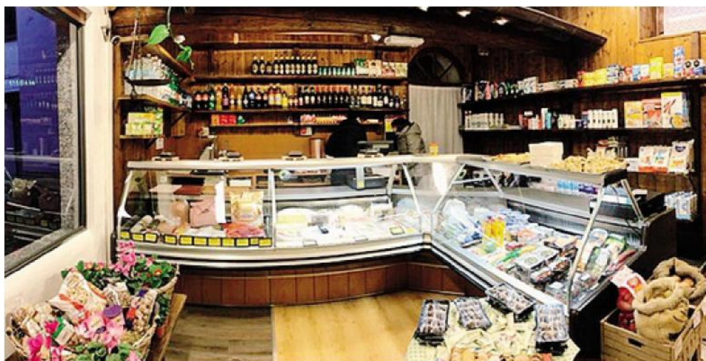
Bando regionale a sostegno dei negozi di prima necessità nei piccoli paesi