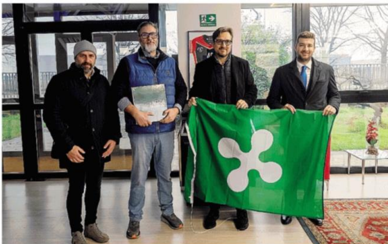
Sopra la visita dell'assessore allo sviluppo economico di Regione Lombardia Guido Guidesi all'azienda Italtapking di Crespiatica, sotto Guidesi con il sindaco di Crespiatica Rizzi alla ditta Adeco, a fianco Guidesi alla Sipcam con la sindaca di Salerno Marcolin