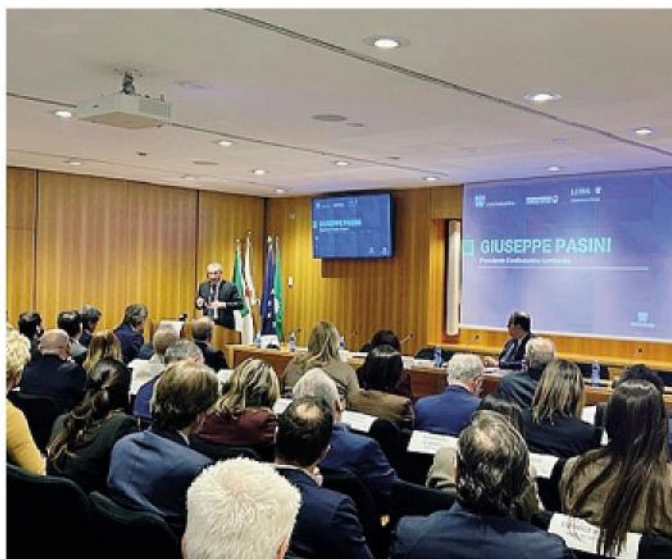
La presentazione del report sulle imprese estere

La provincia di Lecco conta 417 unità locali, corrispondenti al 2,1% delle sedi lombarde. Anche in questo caso, la quota di addetti (1,4%) e di valore aggiunto (0,9%) risulta inferiore rispetto al numero di imprese, indicando una minore incidenza economica complessiva rispetto ad altri territori della