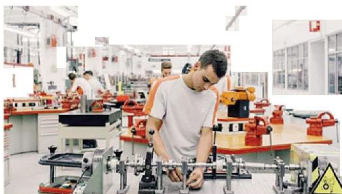
Si punta a consolidare il cuore manifatturiero delle due regioni