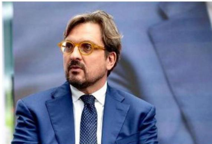
Guido Guidesi , assessore regionale lombardo allo Sviluppo economico