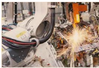
Mercati esteri. Lombardia al top