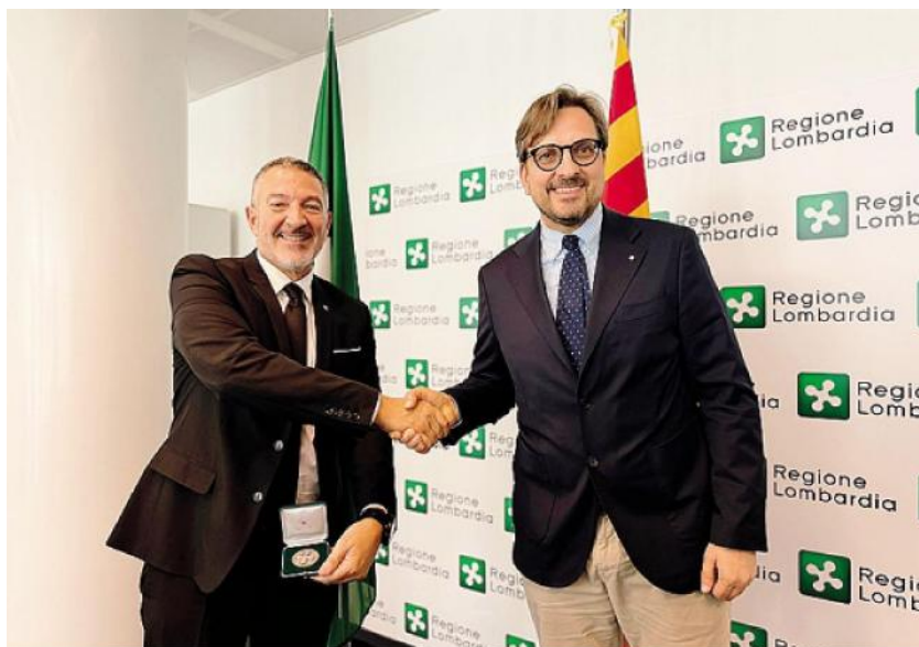
il ministro Miquel Sàmper e l'assessore Guido Guidesi

La Catalunya, dal canto suo, ha assunto la guida con un obiettivo chiaro: accelerare le politiche di competitività e sostenibilità della chimica europea, in un momento in cui il comparto è sottoposto a forti pressioni globali.