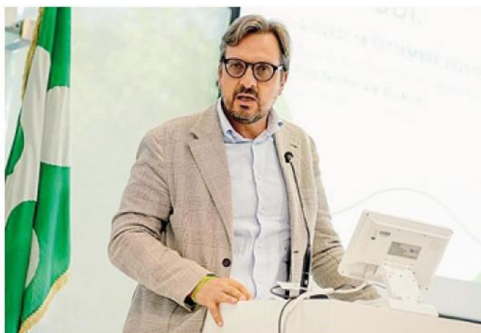
L'assessore regionale Guido Guidesi