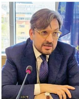
L'assessore Guido Guidesi

«Si è aperta ufficialmente - precisa Guidesi nel documento - la Manifestazione di interesse delle Zone di Innovazione e Sviluppo (ZIS), un nuovo strumento di politica industriale pensato da Regione Lombardia per rafforzare la competitività dei territori e dei settori lombardi e accompagnarli nelle grandi trasformazioni commerciali, tecnologiche e sociali in atto. Le ZIS nascono dalla convinzione che la vera forza della Lombardia risieda nella capacità dei suoi territori di fare sistema, mettendo in rete imprese, università, centri di ricerca, istitu-