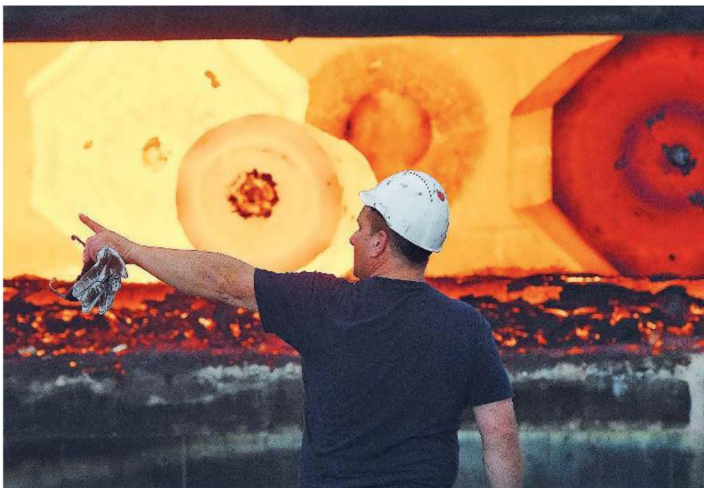
Fonderia. Un operaio al lavoro dà indicazioni davanti a un forno per la produzione dell'acciaio