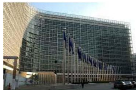
La sede della Commissione europea a Bruxelles