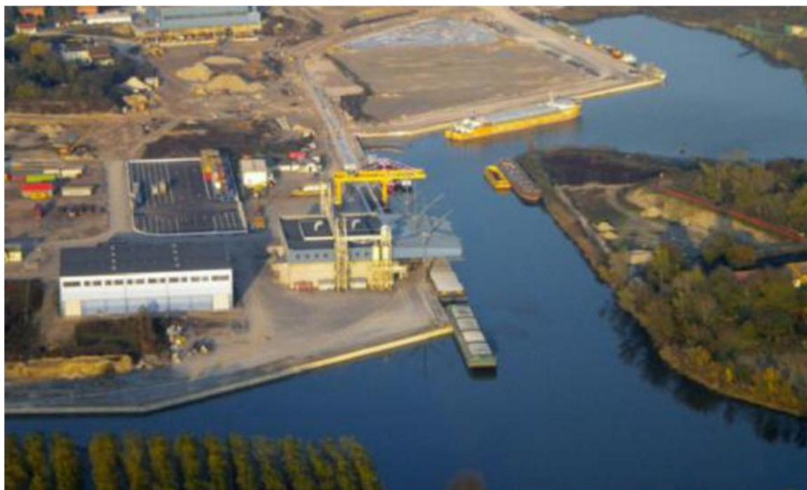
Il porto di Valdaro Mantova e Cremona sono allacciate dalla Zls

• Il 20 marzo al Teatro Bibiena gli stati generali del Nord Est sul futuro della navigazione commerciale