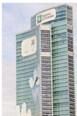
Regione Lombardia, la sede

La dotazione finanziaria messa a disposizione dalla Regione supera i 20 milioni di euro. Ulteriori e dettagliate informazioni sul portale di palazzo Lombardia. ■