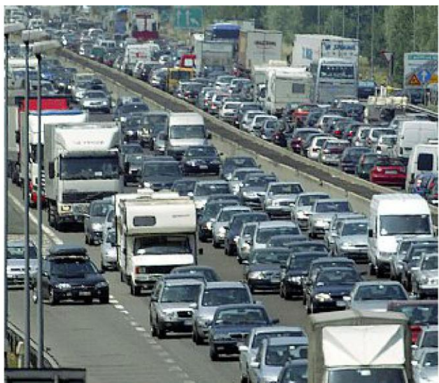
Metafora Lungo l'autstrada Torino-Trieste vivono e lavorano oltre 26 milioni di italiani