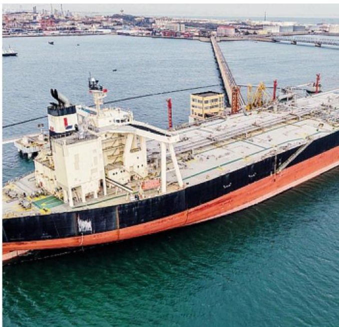
Richiesti strumenti europei pari a quelli per l'emergenza pandemica