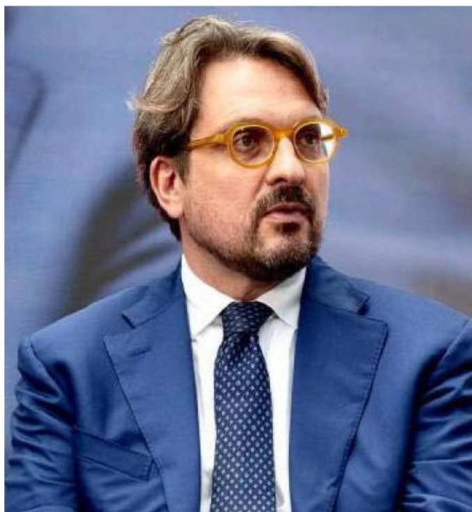
L'assessore regionale lombardo allo Sviluppo economico Guido Guidesi

«I vantaggi concreti ci sono già e sono il frutto del lavoro fatto in questi mesi. Il primo è il Suap digitale, cioè la possibilità di avere un punto unico di investimento e quindi un'interlocazione più semplice rispetto ai diversi soggetti pubblici coinvolti. Il secondo elemento, già normato, è la riduzione dei tempi autorizzativi di almeno il 30%: è un obiettivo scritto, obbligatorio e molto concreto. Il terzo punto riguarda il credito d'imposta, che è un'opportunità già disponibile e da cogliere. E poi c'è uno strumento ulteriore di Regione Lombardia, che illustreremo anche a Cremona, per aiutare i Comuni a strutturare meglio le aree destinate ai nuovi investimenti, rendendo più competitivo sia lo spazio sia l'azione di chi decide di investire».