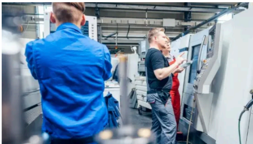
La nuova misura Talenti di Regione Lombardia