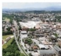
L'area che diverrà parco

Via Milano dal passato industriale sta muovendo verso un futuro green. L'ex stabilimento della Caffaro si trasformerà in un parco dopo il 2030 e gran parte del sedime della ex Ideal Standard diventerà un'area verde attorno al data center di Intred. In tutto sorgerà una fascia green di circa 120mila metri quadrati, la più estesa della città tra via