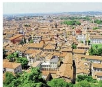
Brescia Fame di abitazioni a prezzi ragionevoli