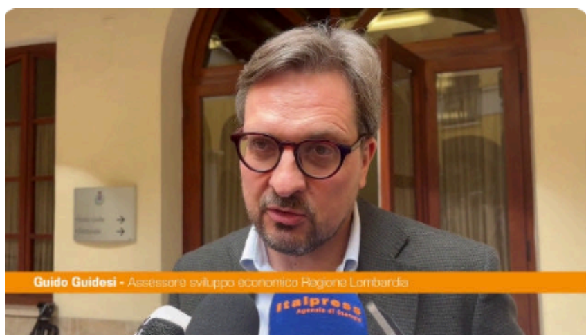
Guido Guidesi - Assessore sviluppo economica Regione Lombardia

https://www.italpress.com/cooperazione-lombardia-veneto-guidesi-aiuto-a-imprese-e-sistema-produttivo/