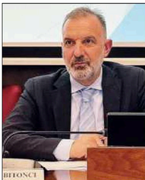
Assessore regionale Massimo Bitonci