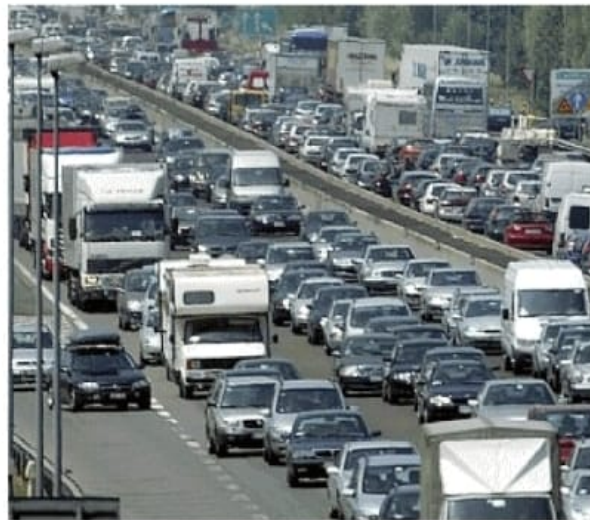
Metafora Lungo l'autostrada Torino-Trieste vivono e lavorano oltre 26 milioni di italiani

Una conurbazione senza più alcuna soluzione di continuità che è il frutto della gemmazione fra un pedemonte industriale storicamente legato all'energia dell'acqua, dei boschi e delle miniere, con una ricca Bassa agricola e zootecnica che, malgrado le divisioni politiche e i limes amministrativi, ha risposto in passato alle stesse logiche funzionali e necessita, oggi, degli stessi strumenti per mantenere aggiornata, attrat-