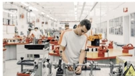
Si punta a consolidare il cuore manifatturiero delle due regioni